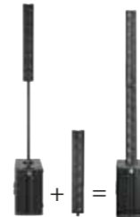
Top-Add-On: 1x E 835