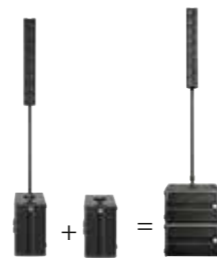
Bass-Add-On: 1x E 110 SUB