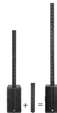
Top-Add-On: 1x E 835