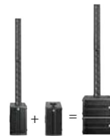
Bass-Add-On 1x E 110 SUB