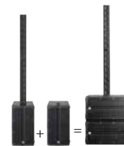
Bass-Add-On: 1x L SUB 1200