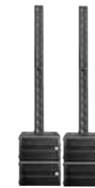
Maximalausbau 2.400 Watt Line Base Twin mit Bass-Add-On