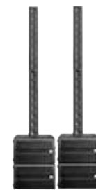
Maximalausbau 2.400 Watt Smart Base Twin mit Bass- und Top-Add-On