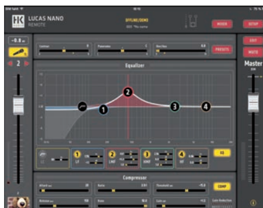
Im Expertenmodus lässt sich deutlich detaillierter am Sound schrauben