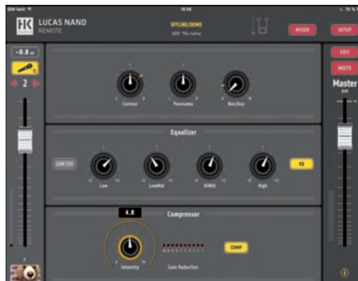
In der einfachen Ansicht der iPad App sind die Bedienelemente auf das Wesentliche reduziert

Großes Kino bietet die Twin-Stereo-Variante, bei der gleich zwei „Nano 608i“ (oder eine „608i“ mit einer „Nano 600“) jeweils im Mono-Betrieb, sich einfach über ein Link-