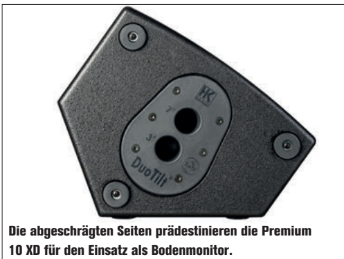
Die abgeschrägten Seiten prädestinieren die Premium 10 XD für den Einsatz als Bodenmonitor.

Das 34 x 49 x 29 cm große Multiplexgehäuse der Premium Pro 10 XD ist mit schwarzem Acryllack beschichtet. Am Boden und der abgeschrägten Seite (für den Einsatz als Bodenmonitor) sind Gummifüße für rutschfesten Stand und etwas Schallent-